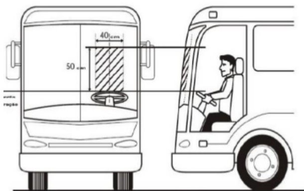
FIGURA 1: ILUSTRAÇÃO - ÁREA CRÍTICA DE VISÃO DO CONDUTOR

Nota 2.: A área crítica de visão do condutor é aquela situada a esquerda do veículo, determinada por um retângulo de 50 centímetros de altura por 40 centímetros de largura, cujo eixo de simetria vertical é demarcado pela projeção da linha de centro do volante de direção, paralela à linha de centro do veículo, cuja base coincide com a linha tangente do ponto mais alto do volante.